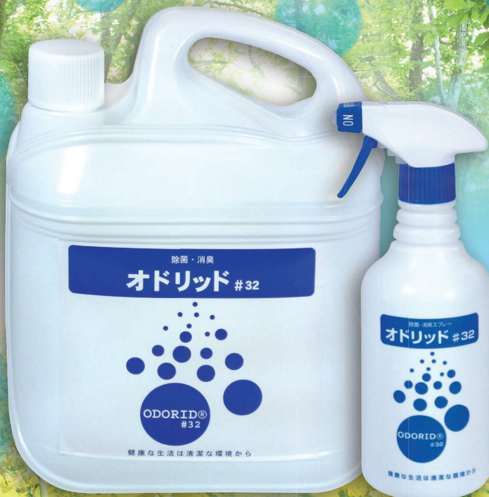
オドリッド #32 4L

お部屋の中は勿論のこと、冷蔵庫、台所、自動車は 既に見えないたくさんの雑菌や臭気が漂っています。 オドリッドスプレーは、従来の芳香剤、脱臭剤とは違い、 嫌な臭いを消すほか、空気中の雑菌を除菌し、 快適な暮らしをおくるための「清潔環境」をつくり出します。